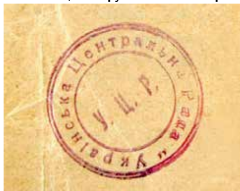
Відтиск печатки Української Центральної Ради. 1917 р.