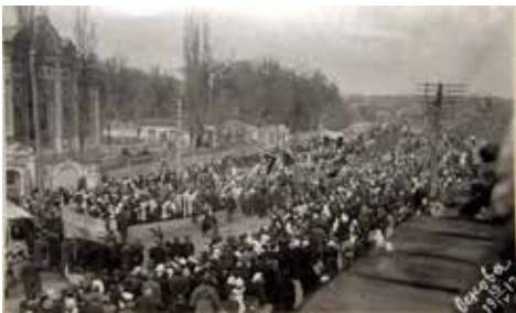
Українська маніфестація у Харкові (Основа). 19 квітня (2 травня) 1917 р. На прапорі (ліворуч) напис: «Хай живе вільна Україна.»

Дати заходів рекомендовано наближувати до дат історичних подій, а місце проведення – топонімічно прив'язувати до тих чи інших місць, пов'язаних з перебігом подій Української національної революції у регіоні, де працює краєзнавчий чи історичний музеї, щоб наголосити на одночасності революційних процесів в центрі (Києві) та на місцях.