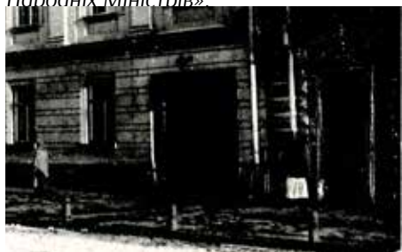
Будинок Генерального секретарства (міністерства) міжнародних справ УНР.

7 листопада (25 жовтня) 1917 року Центральна Рада III-м Універсалом створила автономну Українську Народну Республіку, Генеральний Секретаріат було збільшено на кілька секретарств, а його владу поширено на усі українські губернії. Цей Генеральний Секретаріат діяв до 22 (9) січня 1918 року, до проголошення повної державної незалежності Української Народної Республіки IV-м Універсалом, в якому визначено, що « наш виконуючий орган однині матиме назву Ради Народніх Міністрів ».