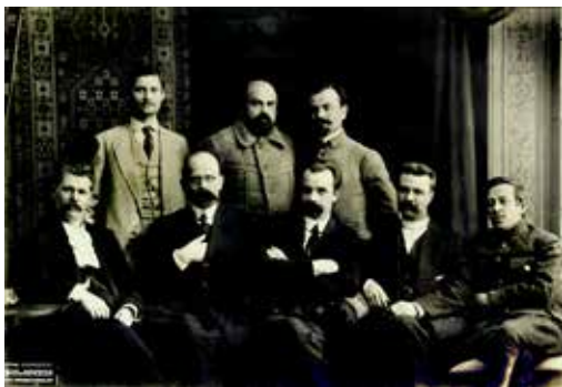
Перший склад Генерального Секретаріату, обраного 15 (28) червня 1917 р.

Уряд складався з восьми секретарств: голова і генеральний секретар внутрішніх справ Володимир Винниченко, генеральний секретар земельних справ Борис Мартос, генеральний секретар військових справ Симон Петлюра, генеральний секретар судових справ Валентин Садовський, генеральний