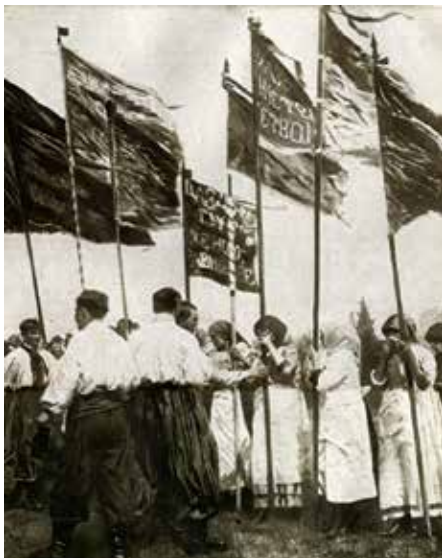
«Проголошення української Республіки».

Документ оголосив землю власністю всього народу, встановив 8-годинний робочий день, скасував смертну кару та визнав національно-персональну автономію для національних меншин.