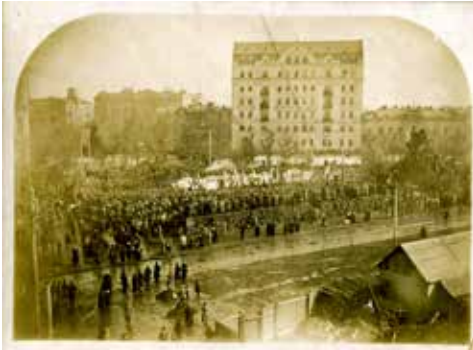
Українська маніфестація у Києві на Софійському майдані. 19 березня (1 квітня) 1917 р.