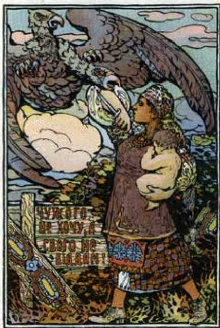
Поштівка «Чужого не хочу, а свого не віддам» Київ, 1917 р.

Протягом грудня 1917 року біля північно-східних кордонів Української Народної Республіки стали концентруватися червоні війська, головнокомандувачем яких було призначено В. Овсієнка. 7 (20) грудня ці війська почали наступ на територію України у двох напрямках формально « надаючи допомогу » створеному ними маріонетковому українському радянському урядові. Так почалася Перша російсько-більшовицька війна 1917–1918 років. Поступово більшовицьке військо захопило Харків, Полтаву, Київ, більшість Лівобережжя, значну частину Правобережжя, інспіруючи більшовицькі повстання в багатьох містах України. На цей час припадає славнозвісний бій під Крутами (29 січня 1918 року) Студентського куреня із загоном