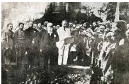
Михайло Грушевський на проголошенні I універсалу Центральної Ради на Софійському майдані у Києві 11 червня 1917 р.

У травні 1917 року український парламент – Українська Центральна Рада, закладаючи основи автономного статусу України направила до Тимчасового уряду у Петербурзі свою делегацію на чолі з членом Ради В. Винниченком з метою визначення національно-територіальної автономії України, рівня компетенції українського уряду, питання організації українського війська, українізації місцевої адміністрації, шкільництва тощо. Тимчасовий уряд, не беручи на себе відповідальності, вказав, що вирішити ці питання можуть лише Всеросійські установчі збори, підготовка яких велася у той час.